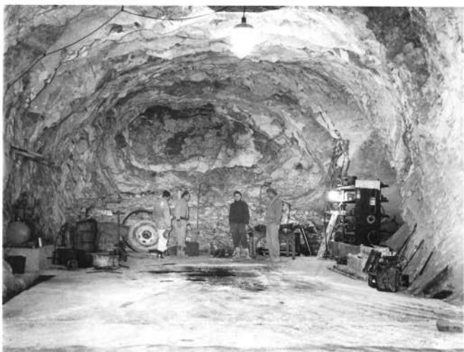
Exploitation souterraine du gypse de Saint-Pierre Les Martigues

Par cuisson du gypse (sulfate de calcium hydraté ( \text{SO}_4\text{Ca}, 2\text{H}_2\text{O} )), à faible température (70 à 95°), on obtient le plâtre ( \text{SO}_4\text{Ca}, 1/2\text{H}_2\text{O} ). Celui-ci a pour propriété de durcir à l'air, en récupérant son eau. Le plâtre est utilisé comme liant. Il sert également à réaliser des moulages ou des cloisons préfabriquées.