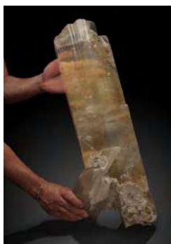
Cristaux de gypse

• En 1989, l'exploitation est définitivement arrêtée par manque de rentabilité et risques géotechniques. A l'arrêt des travaux certains étages d'exploitation ont été remblayés.