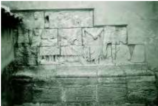
Vue du bas-relief pris dans le mur extérieur de la chapelle

Elle existe depuis le Moyen-Age mais a été en partie reconstruite au XIXe siècle par la famille Demandolx-Dedons qui possédait le château d'Agut. Dans sa façade nord, est encastré un bas-relief gallo-romain en pierre de la Couronne, appartenant probablement à un mausolée monumental. Il représente une scène familiale à caractère funéraire, daté du Ier s. ap. J.-C. En relation avec une villa de la même époque, située à quelques centaines de mètres de là, ce bâtiment honore le premier maître et fondateur du domaine résidentiel et agricole de Saint-Julien. Symbole de la romanisation de Martigues, il exprime l'intégration des élites locales dans un nouveau système politique et social. Depuis 1923, il est classé au titre des Monuments Historiques.