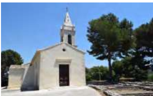
L'église de Saint-Pierre et le début de l'oppidum à droite

C'est aussi l'emplacement d'un site archéologique dont les vestiges sont connus depuis le XIXe siècle. Plusieurs campagnes de fouilles, étalées entre les années 1970 et les années 2000, ont permis de mettre en évidence une occupation continue du site depuis la Préhistoire jusque vers 50 ap. J.-C. La période gauloise reste la plus importante avec la présence d'un oppidum, une agglomération fortifiée, constituée de centaines de maisons à pièce unique, bâties en pierres et briques crues, organisées en îlots le long de rues étroites sur toute la butte, soit 1,5 hectares.